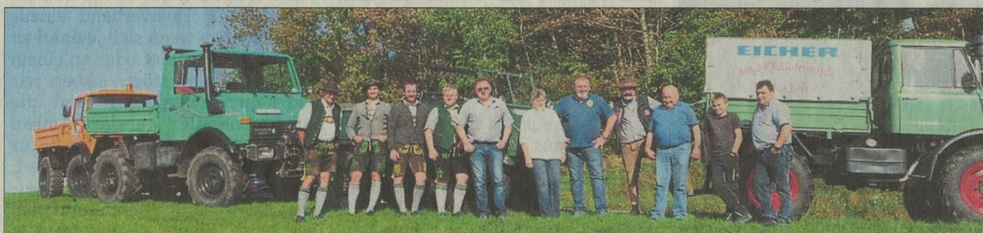
Mit fünf verschiedenen Unimog-Generationen ging es in den Bayerischen Wald.